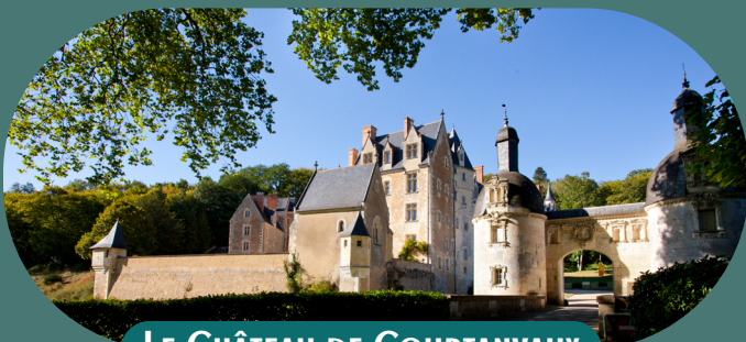
LE CHÂTEAU DE COURTANVAUX

Illustrations et mise en page : atelier-ju.fr / Ne pas jeter sur la voie publique *Règlement du concours disponible sur www.perche-sarthois.fr