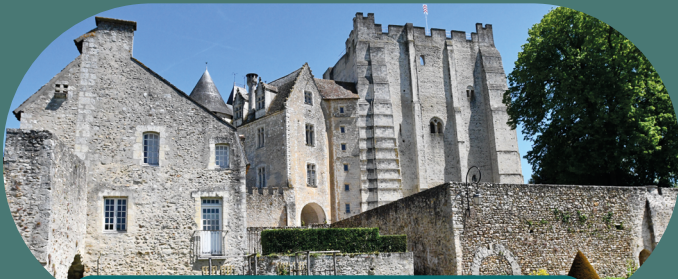
LE CHÂTEAU DES COMTES DU PERCHE

Laissez-vous conter les histoires de ces quatre édifices majeurs : le Château des Comtes du Perche, le Château de Montmirail, la Commanderie d'Arville et le Château de Courtanvaux.