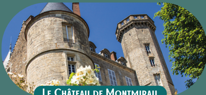
LE CHÂTEAU DE MONTMIRAIL