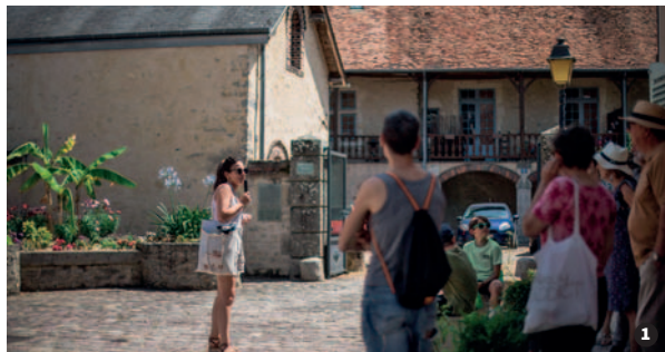
Visite de La Ferté-Bernard ❶