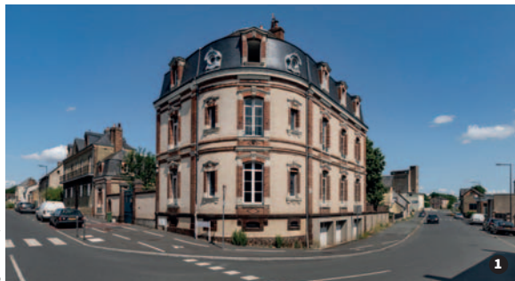
Maison, 1 rue Coursimault à Saint-Calais 1