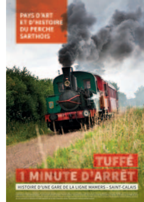
Affiche © C. Derre / Photo J.-P. Berfiose - Cemjika

→ Animations en lien avec l'exposition et la thématique du paysage à retrouver pages 3, 17, & 20.