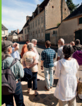
Visite en Perche Sarthois